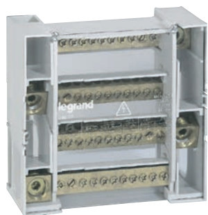
0 048 77