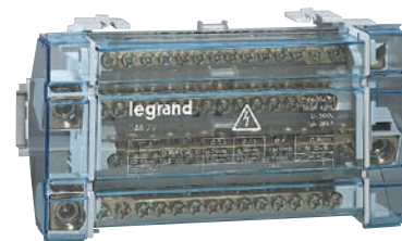
0 048 79

Подключение кабеля с/без кабельных наконечников Starfix Самозатухание при 750°C: 5с, при 960°C: 30с Установка на рейку DIN Оснащены держателем этикеток