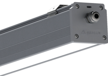
ДСП49-40-003 Blade 840