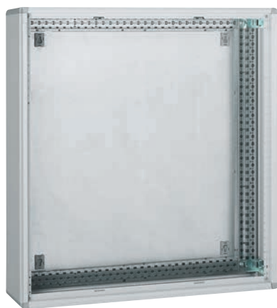
0 204 06