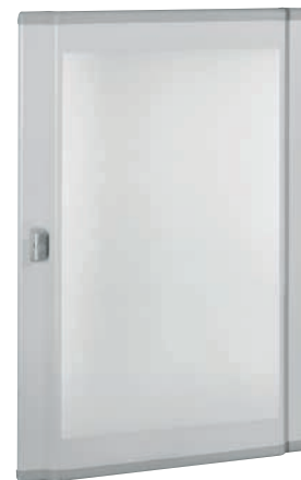
0 212 61

IP 43 - IK 08 с уплотнителем IP 43 и дверью IP 40 - IK 08 с дверью IP 30 - IK 07 без дверей