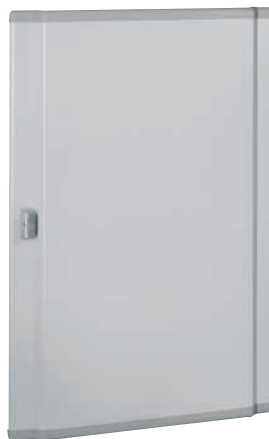
0 212 51