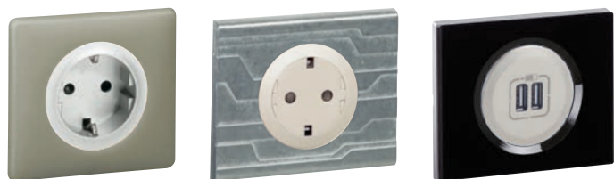
0 671 53 (Грин Перкаль)