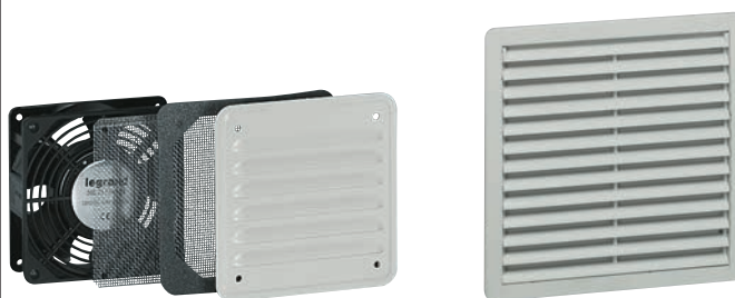
0 348 17