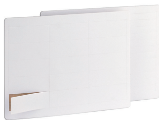
Пластины для нанесения надписей