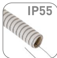
Степень защиты IP55