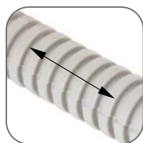
Длина бухты на выбор