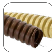
Цвет на выбор