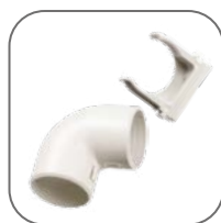
Все необходимые аксессуары