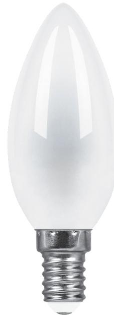
Арт. 25955, 25957, 38005, 38007

Светодиодные лампы FILAMENT LB-73 и LB-713 TM FERON – идеальное решение для хрустальных люстр и открытых светильников, в которых источник света является частью дизайна. Применяются как для общего, так и для декоративного освещения.