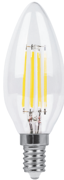
Арт. 25956, 25958, 38006, 38008