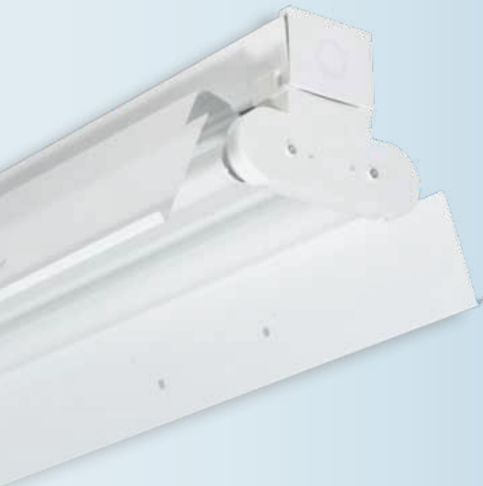
Крепление защитной решетки