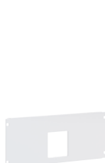
3 387 53