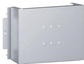
3 389 20

оборудование для монтажа DPX-IS 250 на пластине