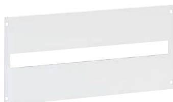
3 382 73