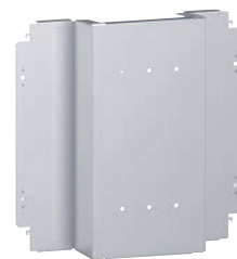
3 387 20