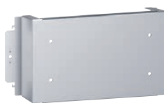
3 387 01

оборудование для монтажа DRX/DPX 3 630 на пластине