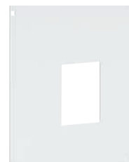
3 387 70