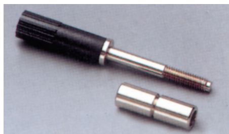
Винт + рукав