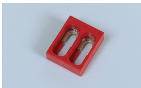
2-полюсная перемычка типа SCB/4; HSCB/6