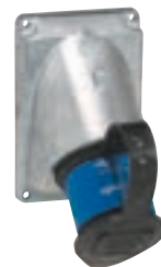
5 551 28