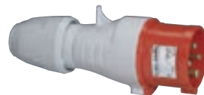
5 551 28