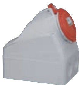
5 552 58

розетки, вилки, мобильные розетки, накладные вилки и розетки с блокировкой и выключателем