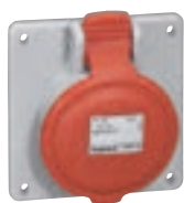
5 551 88