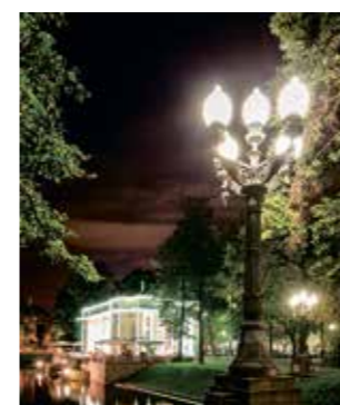
г. Москва, Патриаршие пруды