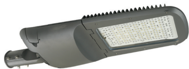
ДКУ63-100-001 Favorit 750