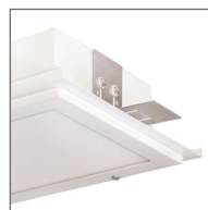
ДВО16: крепление на монтажные скобы