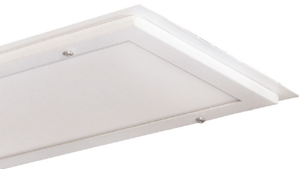
ЛВО16-2х28-031 LD HF