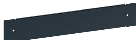
3 382 03