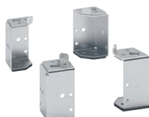
3 382 00