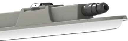
ДСП51-40-012 Leader RA 840