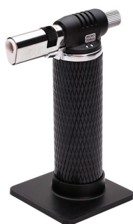
X-220 (KVT) портативная многофункциональная газовая горелка