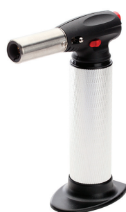
X-350 (KVT) портативная многофункциональная газовая горелка