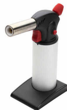
X-500 (KVT) портативная многофункциональная газовая горелка